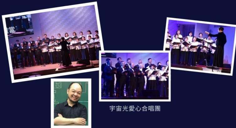
宇宙光愛心合唱團